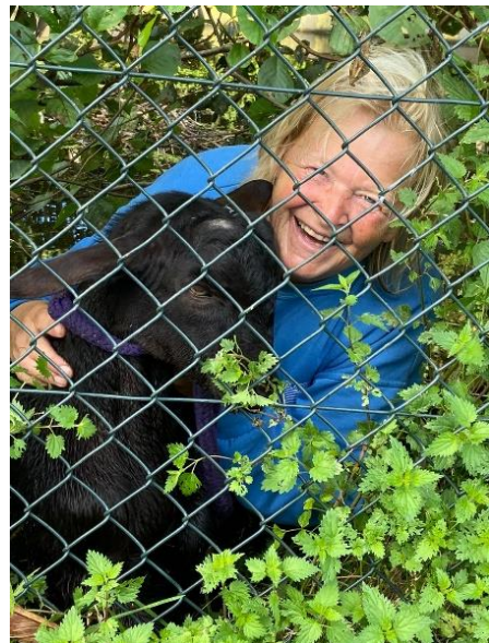
Jonge dieren uit de sloot redden doen we ook!

Wij maken gebruik van een rooster waarop vermeld wordt wie op welk dagdeel beschikbaar is om de dieren te voeren en het park te onderhouden. In normale omstandigheden neemt de taak 1,5 uur per keer in beslag. Er zijn momenteel 19 vrijwilligers actief.